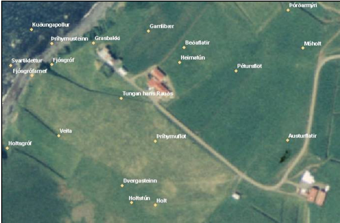
Mynd 13. Dvergasteinn. Hluti af örnefnum á jörðinni Bakka sett á nýlega loftljósmynd úr LUKR.