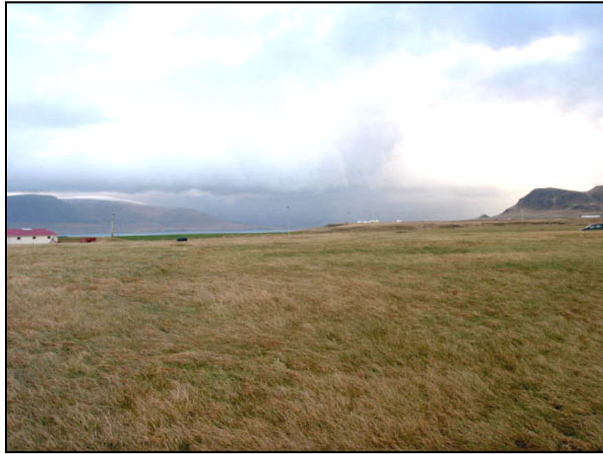
Mynd 18. Túnið þar sem bústaðurinn hefur líklega staðið. Horft til N.