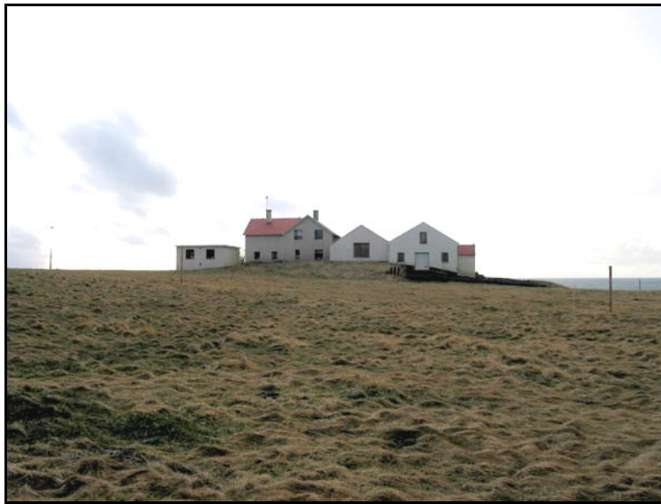
Mynd 4. Túnið þar sem útihús 306-3 var staðsett. Horft til SV. Ljós. SUP.

Þetta hús er horfið vegna túnasléttunar. Ekki langt frá þeim stað sem kallaður er "Gamli bær" (306-19).