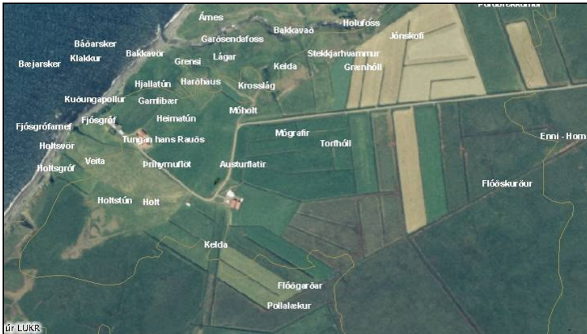
Mynd 12. Flóðgarðar. Hluti af örnefnum á jörðinni Bakka sett á nýlega loftljósmynd úr LUKR.

Örnefni. Ekki vitað um nánari merkingu og nú er þarna tún.