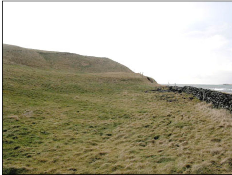
Mynd 8. Hjallatún, þar sem talið er að hjallurinn hafi staðið. Horft til SV. Ljós. SUP.

"Norðar [en Hvammur] þar sem heitir Hjallatún, hefur verið lending áður fyrir." 29