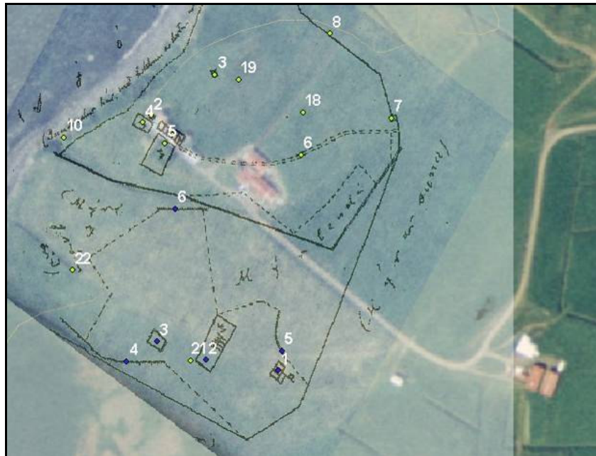
Mynd 17. Bakkaholt (bláir punktar). Túnakort 1916 lagt yfir nýlega loftljósmynd úr LUKR.