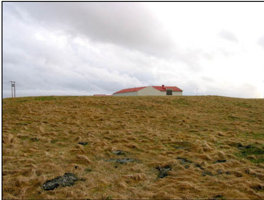
Mynd 11. Svæðið þar sem Gamli bær hefur líklega staðið. Horft í S.

Samkvæmt örnefnakorti af jörðunni er Gamli bær um 70 metra suðaustur af núverandi íbúðarhúsi, á túni í ræktun, (sjá mynd 6).