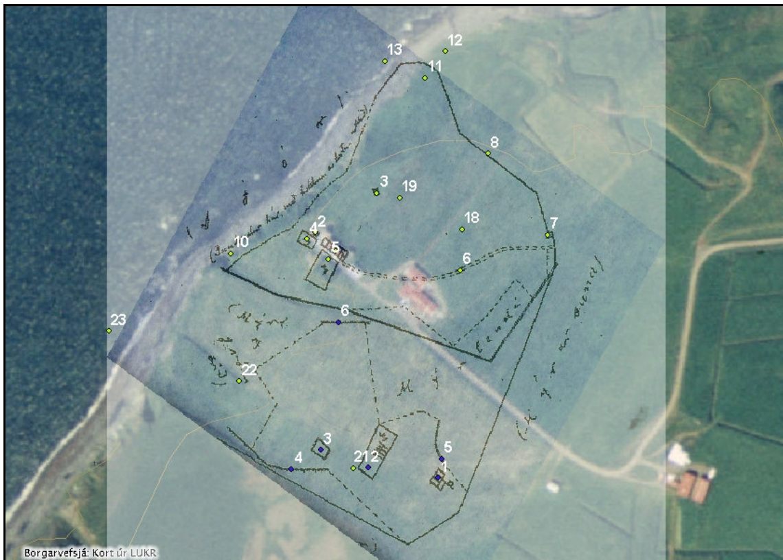
Mynd 1. Túnakort 1916 sett yfir hnitsetta loftmynd úr LUKR.

Það kort sem aðallega var notað við skráninguna er túnakort frá 1916. Þessu korti er varpað á nýlegan kortagrunn úr Landupplýsingakerfi Reykjavíkurborgar (LUKR) og þannig má staðsetja hluta af fornleifunum. Reynt er að setja staðsetningarhnit (ISN93) á flestar fornleifar með þessum hætti en augljóslega er einungis um tilgátur að ræða þegar fornleifar eru horfnar af yfirborði.