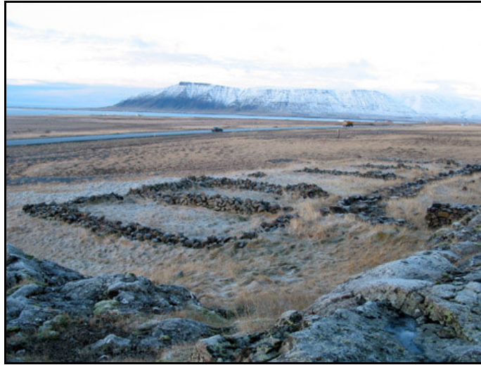
Mynd 14. Arnarhamarsrétt. Horft til NV. Ljós. SUP.