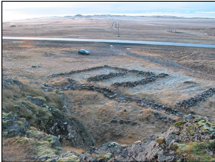
Mynd 15. Arnarhamarsrétt séð frá hömrunum. Horft til SV. Ljós. SUP.

Austur af Bakka, í Esjuhlíðum. Um 30 metra austur af Vesturlandsvegi. Rústin er utan í litlu hamrabelti/klettum sem kallað er Arnarhamar og dregur réttin nafn sitt af því.