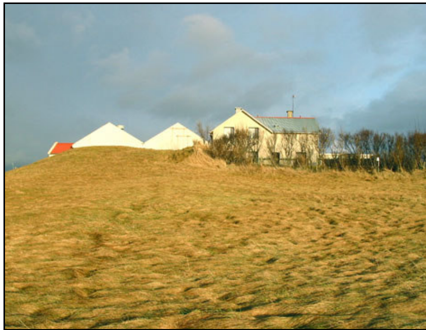
Mynd 5. Staðsetning kálgarðs (306-5) við núverandi íbúðarhús. Horft til NA.

Samkvæmt túnakorti 1916 (sjá mynd 3) var annar kálgarður sunnan við bæinn (306-1) og um átta metra austur af hinum kálgarðinum (306-4). Garðurinn var um 20x30 m á stærð. 22