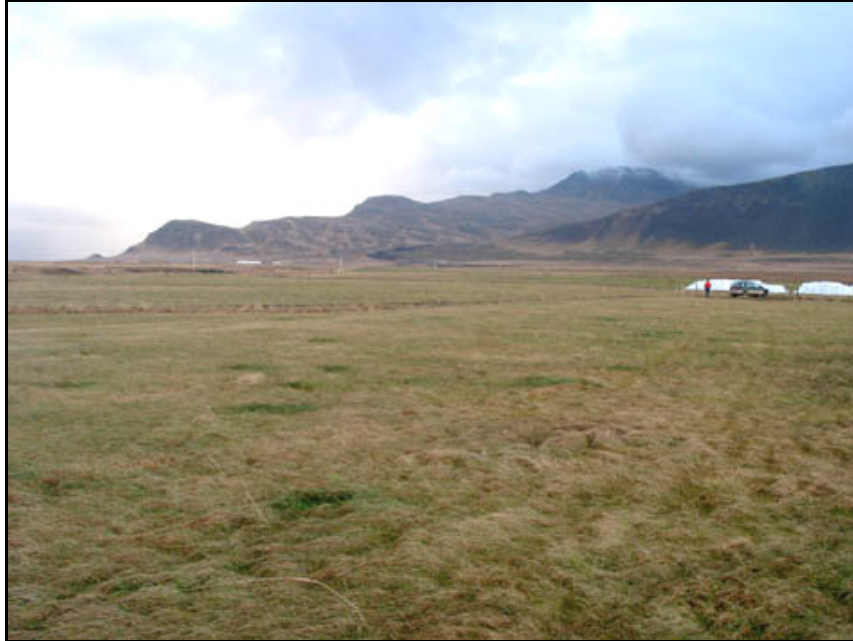
Mynd 20. Túnið þar sem garðurinn var líklega. Horft til NA.