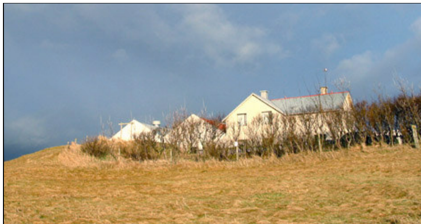
Mynd 2. Núverandi íbúðarhús sem byggt var ofan á eldri bústað. Horft til NA. Ljós. SUP.