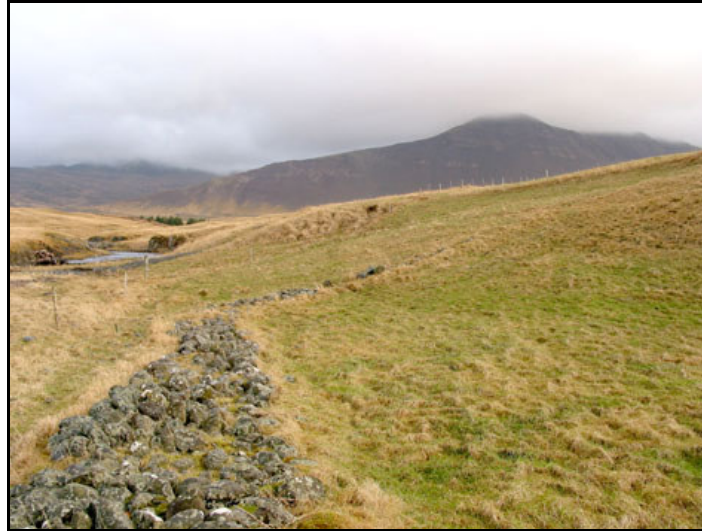
Mynd 9. Varnargarður við Hjallatún. Horft til A upp með ánni. Ljós. SUP.

Sjógarður við Hjallatún, fyrir neðan brekkur í túninu. Garðurinn liggur samhliða Blikdalsánni í vestur og beygir síðan í suðvestur með ströndinni, þ.e. 22 metra í norðaustur/suðvestur meðfram ströndinni og 32 metra vestur/austur samhliða ánni. Er í um 186 metra norðnorðaustur frá íbúðarhúsi og um 56 metra suðvestur af ánni.