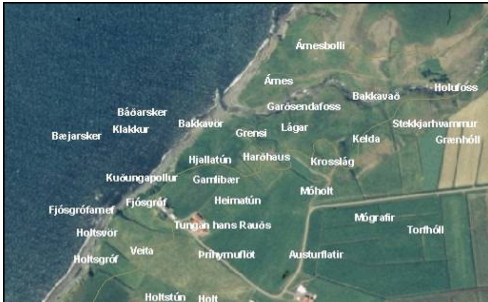
Mynd 7. Hluti af örnefnum Bakka sett yfir nýlega loftmynd úr LUKR.