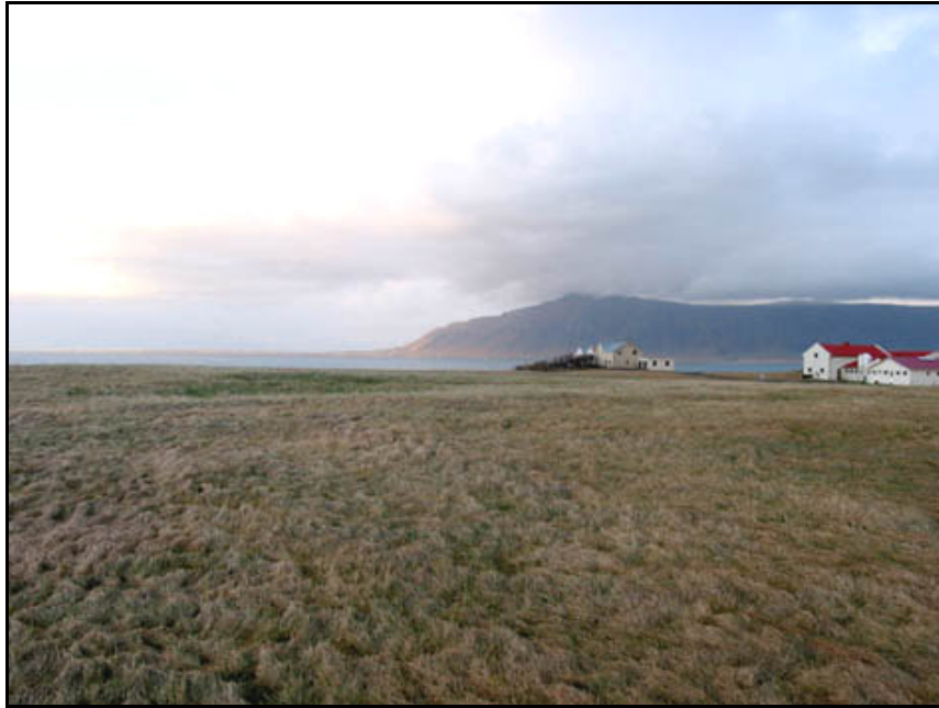
Mynd 19. Túnið þar sem kálgarðurinn var líklega. Horft til NV. Ljós. SUP.