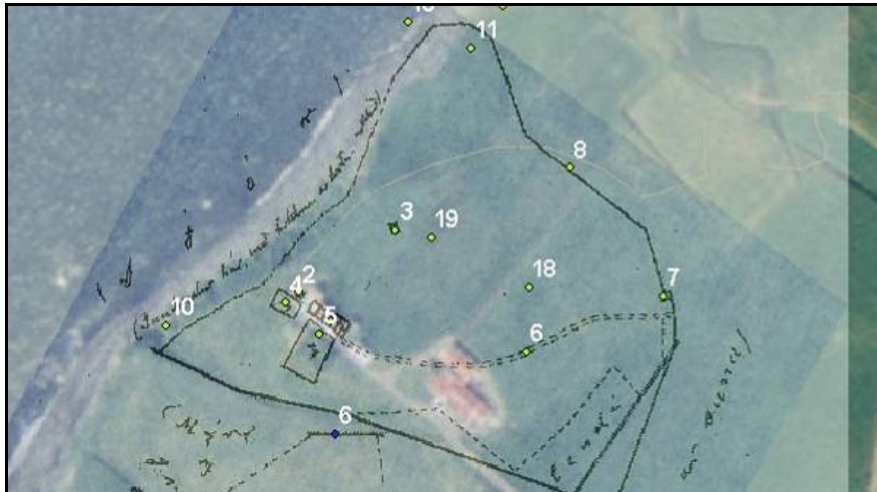
Mynd 6. Túnakort af Bakka frá 1916 lagt yfir nýlega loftmynd sem er að finna í LUKR. Heimtröðin nr 6.

Horfin vegna túnasléttunar og yngri húsbygginga.