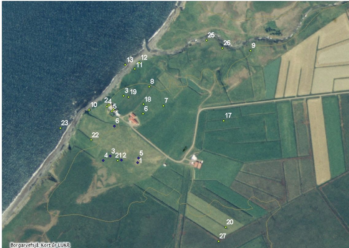
Mynd 21. Staðsetning fornleifa við bæjarstaði Bakka (gult) og Bakkaholts (blátt). Grunnur er nýleg loftljósmynd fengin úr LUKR.

Íbúðarhúsið á Bakka er með elstu húsum á Kjalarnesi eða frá 1923. Það er í fullri notkun og fellur það því í hlut húsadeildar Minjasafns Reykjavíkur að sjá um skráningu þess. Þetta hús var byggt ofan á íbúðarhúsið sem teiknað var á túnakortið 1916. Ýmislegt bendir til þess að enn eldra bæjarhús sé í túninu norðaustan við núverandi íbúðarhús og skal fylgjast vel með framkvæmdum á því svæði. Örnefni eins og Garðsendafoss, Garðsendavað og Stekkjarhvammur benda til þess að fyrir aldamót hafi mátt finna garð og útihús austar en þau hús sem teiknuð eru upp á túnakorti 1916. Það mætti rannsaka það svæði betur til að athuga hvort þar megi enn finna einhverjar fornleifar.